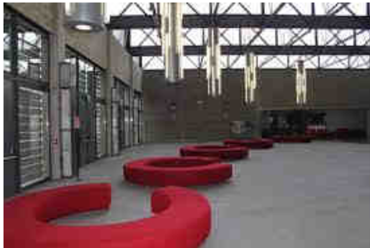
Il foyer delle Fonderie Teatrali Limone